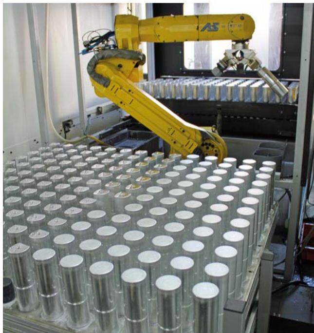
Der Roboter bedient zwei 5-Achs-Fräzbearbeitungszentren, zusätzliche Behandlungs- und Reinigungseinheiten sowie mehrere Palettierplätze

die ständige Selbstkontrolle der Werker. Darüber hinaus setzt man auf moderne Spitzentechnologie für die Maßkontrolle. Messungen erfolgen in einem speziell hierfür eingerichteten Reinraum, dessen Klimatisierung in engen Grenzen überwacht wird. Die hier eingesetzte Koordinatenmessmaschine liegt mit einer Messgenauigkeit