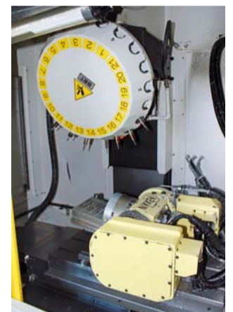
Blick in den Arbeitsraum eines der beiden 5-Achs-Fräzbearbeitungszentren

„Vielfach habe ich den Eindruck, dass Bearbeitungsaufträge vorschnell ins ferne Ausland abgegeben werden, weil man zu sehr auf die reine Differenz der Lohnkosten schaut“, setzt Tobias Wenz hinzu. Dabei spielten die Lohnkosten bei entsprechend hoher Automatisierung gar nicht mehr eine so entscheidende Rolle. Zudem müsste man erhebliche weitere Kalkulationsposten berücksichtigen. Dazu zählten nicht nur die gegenüber dem Ausland wesentlich geringeren Transportkosten und -zeiten, sondern auch weitere Faktoren